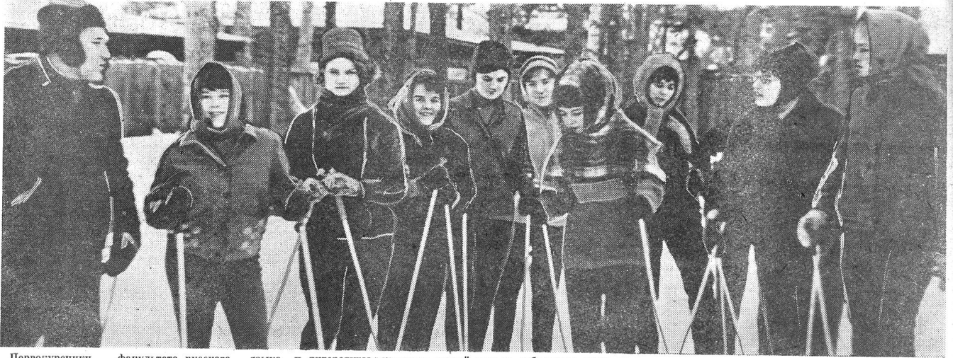
Первокурсники факультета русского языка и литературы встречают новый год и сибирскую зиму на лыжах.