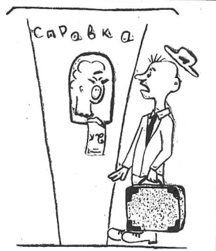
Рис. Н. Дышловой, ст. 381 гр.

Томичи — народ чуткий и внимательный. Поэтому я всегда обращаюсь прямо к ним, минуя милонидных девушек горсправки.