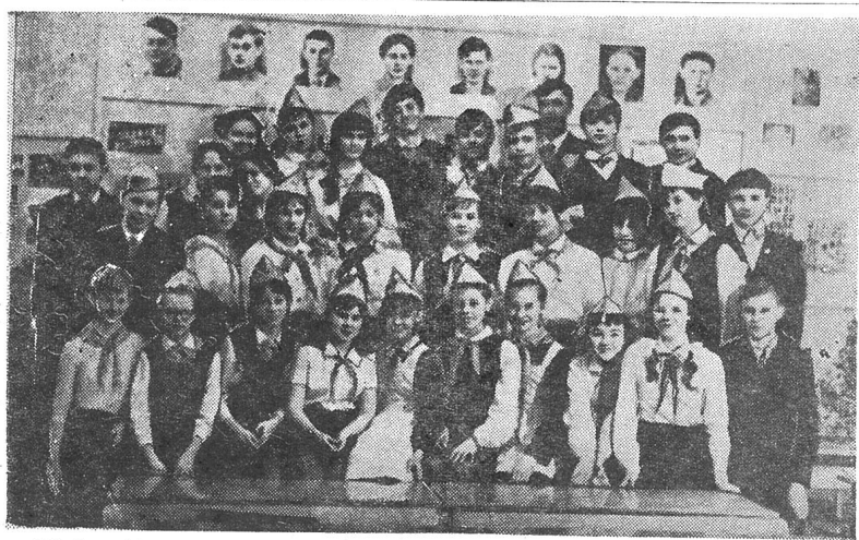
НА СНИМКЕ: 7 б класс 8-й школы г. Томска.