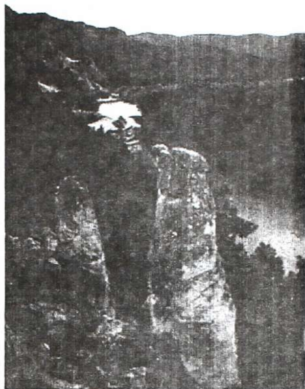
Останцы выветривания в бассейне реки Белый Июс

Район прохождения практики знаменит и исторически важными объектами. В самом поселке частично исследована палеологическая стоянка, возраст которой составляет около 35 тысяч лет. В 45 километрах от Малой Сыи, в горной гряде Сундуки, обнаружены древние астрономические пункты тагарских жрецов, датируемые 5-3 веками до нашей эры. Считается, что бассейн реки Белый Июс был одним из самых значительных культурных и культово-религиозных центров древней Сибири.