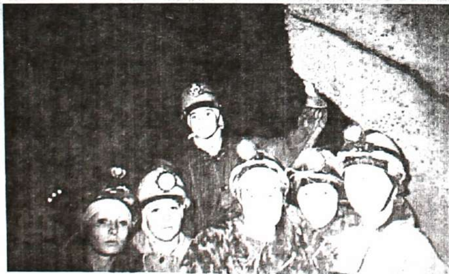
Самые храбрые – географини ТГПУ

Студенты-географы естественного факультета.