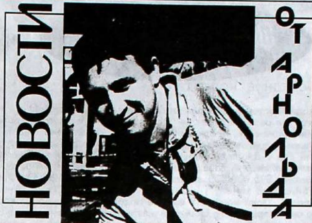
ДЕРЕСНЕ МОДЕ: НОВОЕ-ХОРОШО ЗАБЫТОЕ СТАРОЕ.

Это было лет двадцать назад на биофаке МГУ. Один доцент, читая лекцию по ботанике, имел неосторожность похвастаться, что по любому зернышку определит, какое это растение. Какой-то студент-умник, кушая завтрак, выковырял у кильки глазик и засушил. Приносит на следующую лекцию доценту и говорит, что мол вы говорили, что можете. Тот повертел-повертел и говорит, что да, пожалуй, он погорячился и пока не может сказать, что это за растение, но посмотрит дома по справочникам или спросит у друзей, и на следующей лекции обязательно скажет. Студент ушел очень довольный тем, что так легко провел опытного доцента. Через неделю доцент отчитал лекцию и подзывает студента. Увы, говорит, я не знаю, что это за растение, но я его посадил и оно у меня выросло. И смотрите, что получилось. Показывает стакан граненый с землей, а оттуда торчит хвост селедки.