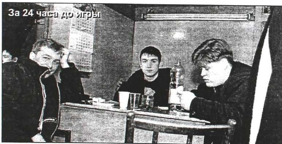
За 24 часа до игры