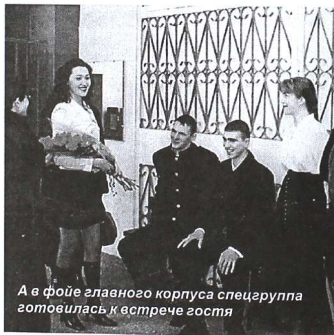
А в фойе главного корпуса спецгруппа готовилась к встрече гостя

Нефтяная компания «ЮКОС» объявила о введении стипендий для профессоров, доцентов, аспирантов и студентов вузов. ТГПУ получил возможность подать на получение стипендии документы одного профессора, одного доцента, одного аспиранта и трех студентов. О сваливших-