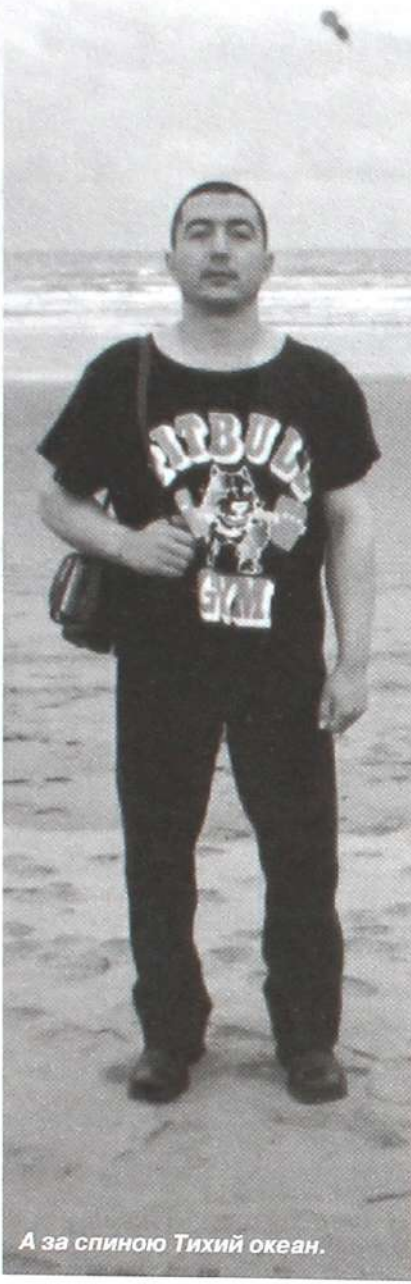
А за спиной Тихий океан.

канцев, я шагнул-таки на четвертую ступень мирового пьедестала.