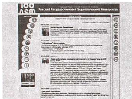
БИБЛИОТЕКА ТГПУ on-line

Адрес сайта www.tspu.edu.ru . И именно там первой появляется самая свежая информация о жизни университета.