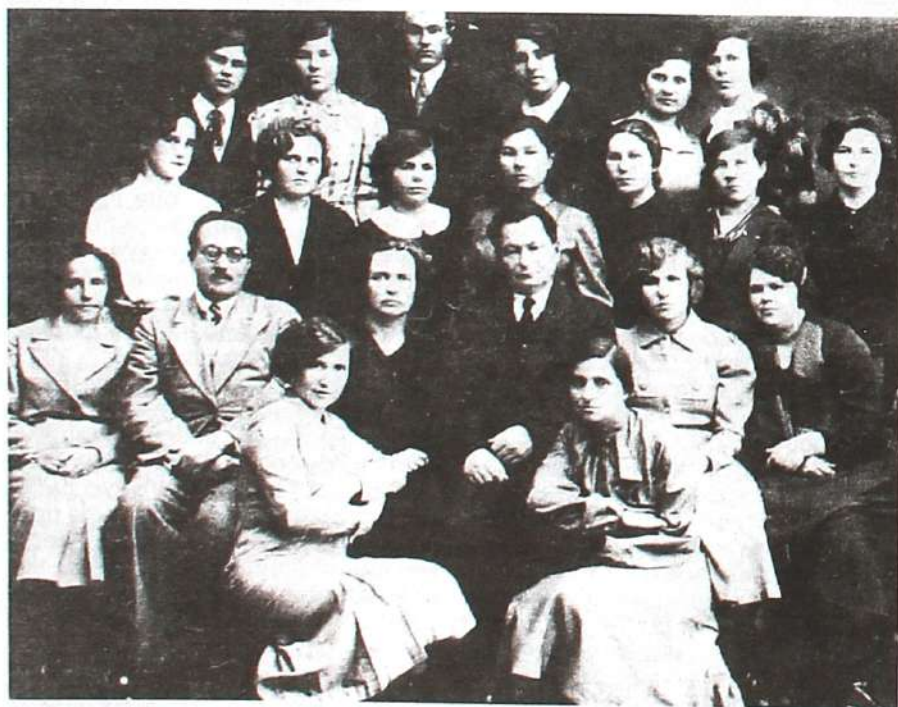
Первая группа дошкольного факультета Томского пединститута. 1935—1939 гг.