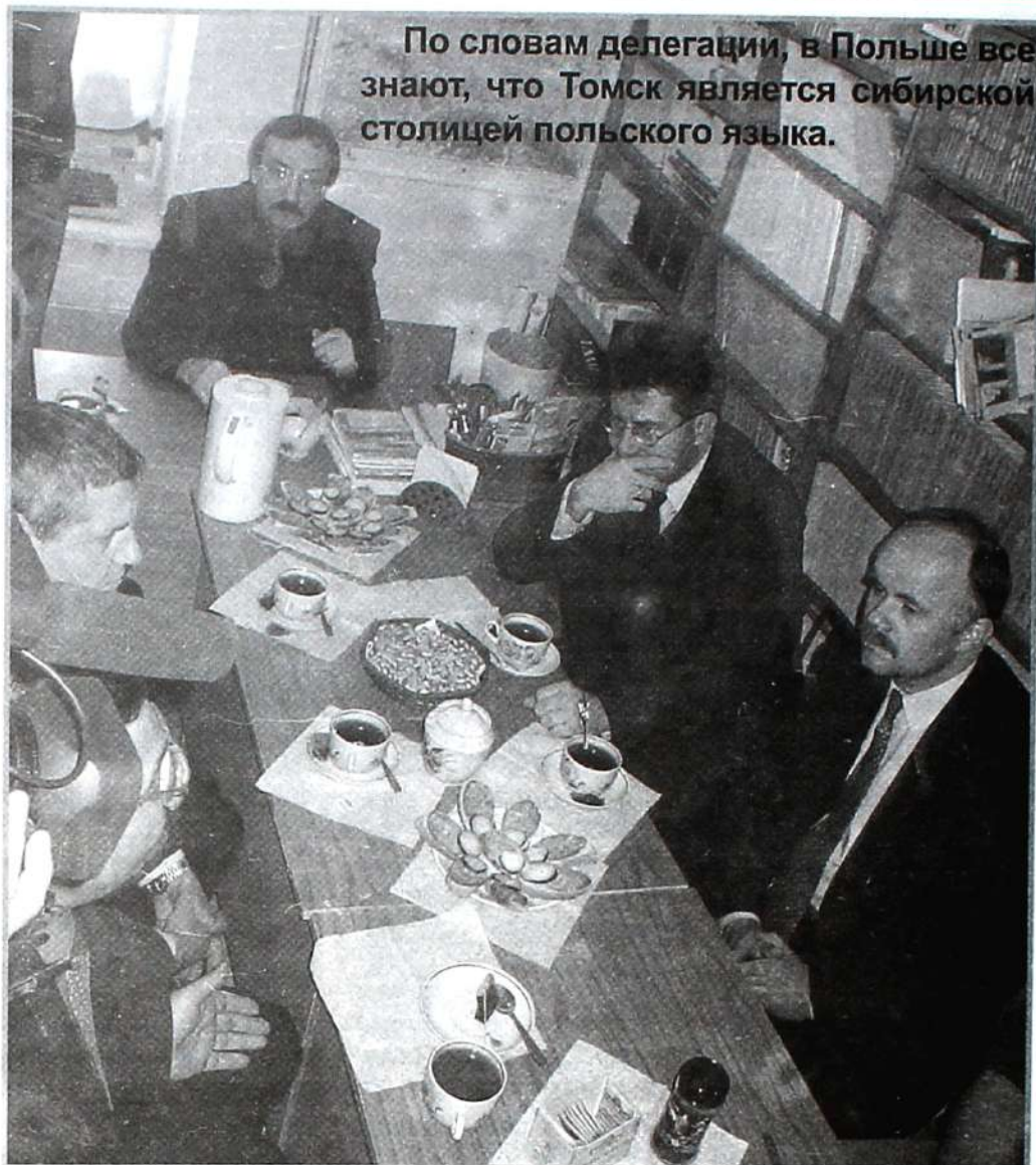
По словам делегации, в Польше все знают, что Томск является сибирской столицей польского языка.

Делегация поляков в Томске находится с рабочим визитом, в план которого входят и другие Сибирские города. По словам поляков нужно заметить, что Томск в Сибири – это самое перспективное место по развитию польского языка. Томск находится в центре "польской" карты от