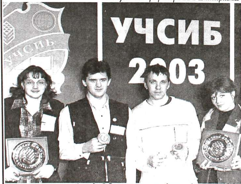
Награды Сибирской ярмарки в руках делегации ТГПУ

Более 500 структур и организаций собрались в Новосибирске в марте этого года на официальной выставке Российской академии образования «Учсиб. Интеллектуальные ресурсы Сибири-2003». Выставка «Учсиб» является единственным в своем роде мероприятием, где в свободном режиме могут пообщаться коллеги-педагоги со всех уровней педагогической системы – от детских садов и школ до ведущих вузов Сибири. Аудитория выставки – работники сферы образования и абитуриенты.