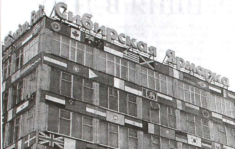
Здание Сибирской ярмарки