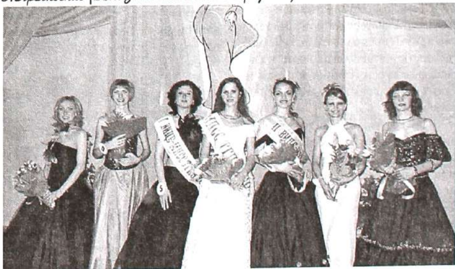
Участницы конкурса: фотография на память