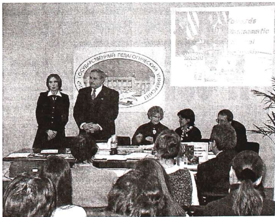
Международный семинар «Гражданское образование»