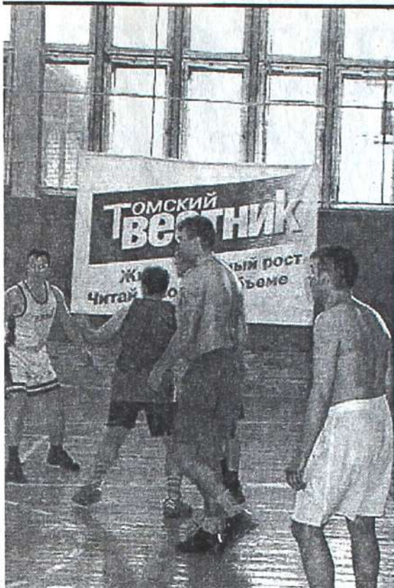
Суперигра: судьи против тренеров