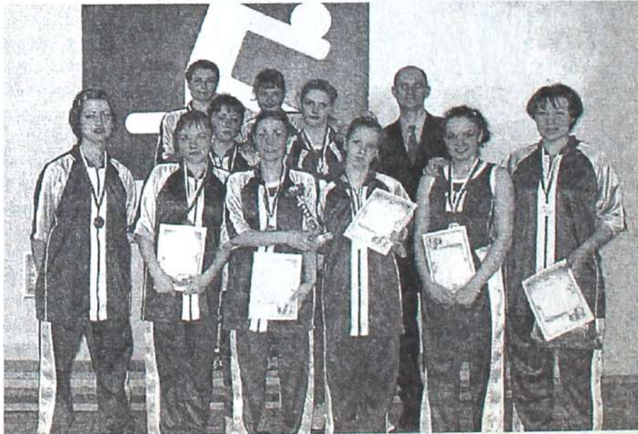
Команда ТГПУ - Бронзовые призеры Кубка

Закончился этот знаменательный день товарищеской встречей женских команд ТПУ и ТГУ. Эта игра уже ничего не решала, но девушкам из «политеха» было все равно приятно — 63-51, в пользу ТПУ.