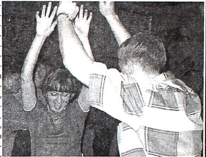
«Двухметровая» вечеринка в клубе «GARAGE»

Что касается мужских команд, то первыми на площадке встретились УрГЮА (Екатеринбург) и ТГАСУ (Томск). Уральская команда новая, молодая и в соревнованиях для них было важно само участие. Чуть-чуть не хватило сил для победы Барнаульской команде МГУКИ. В начале игра шла ровно, а потом три проигранных очка и команда КузГТУ вышла вперед. Игра закончилась со счетом 81-78 в пользу Кемерово. Интересной по накалу оказалась игра Красноярского политехнического и Бийского технологического. Однако команде БТИ повезло чуть больше, поэтому игра закончилась со