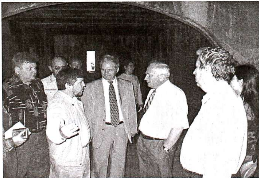
Первый визит губернатора в строящийся корпус (июль 2002)

Говоря о поддержке, хочется отметить, что корпус практически с самого начала строительства находится под