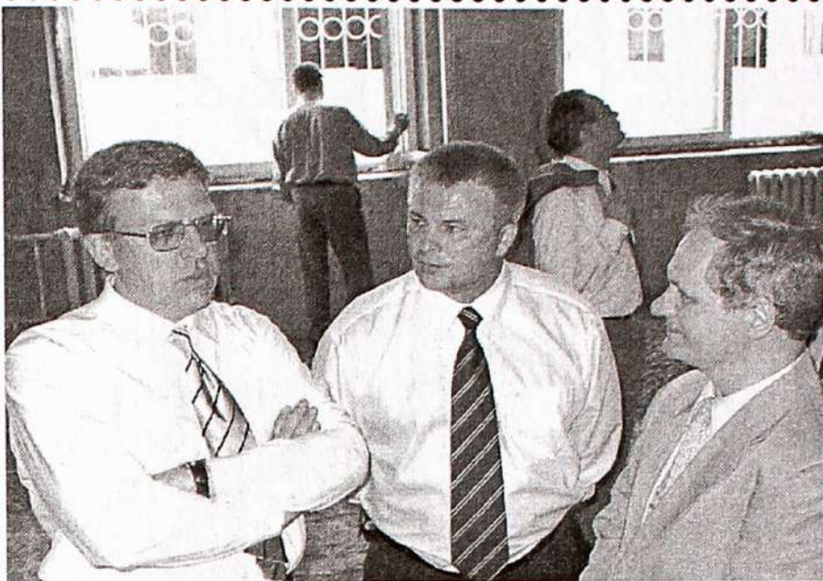
Визит министра финансов в корпус на Каштаке (июнь 2003)

личным контролем губернатора, который помогал в организации строительства и финансирования. Кроме того, губернатор пригласил поскитить строящийся объект министра образования РФ Филиппова Владимира Михайловича и заместителя председателя правительства РФ, министра финансов РФ Кудрина Алексея Леонидовича. Что примечательно, именно внутри будущего корпуса ТГПУ (если быть точным - в будущей столовой) 22 июня этого года состоялся разговор министра финансов