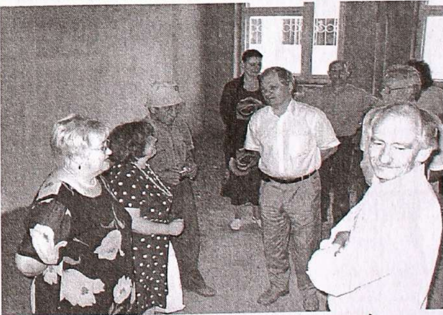
Первый ректорат в новом корпусе (июнь 2003)

Еще одна причина, почему мы рассматриваем ввод корпуса на Каштаке как жизненно необходимый —