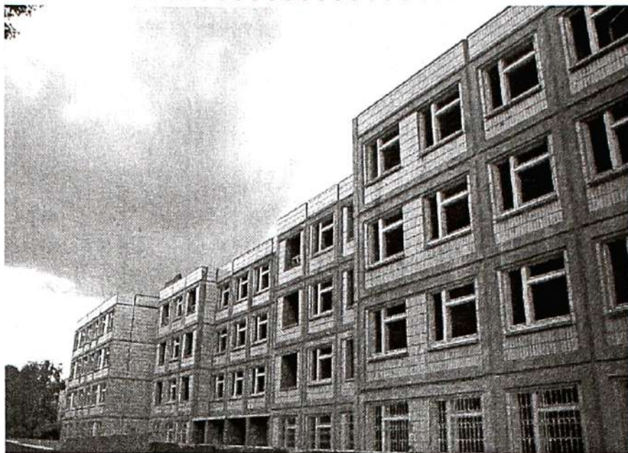
Так выглядело здание в июле 2002

вращение долгостроя в университетский корпус ушло 13 месяцев?