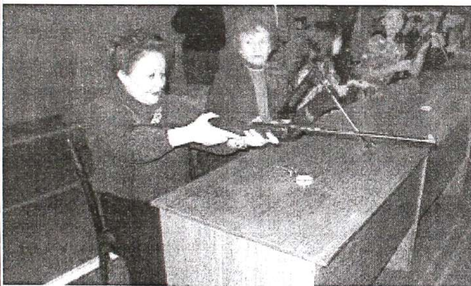
Ведет стрельбу кафедра лингвистики