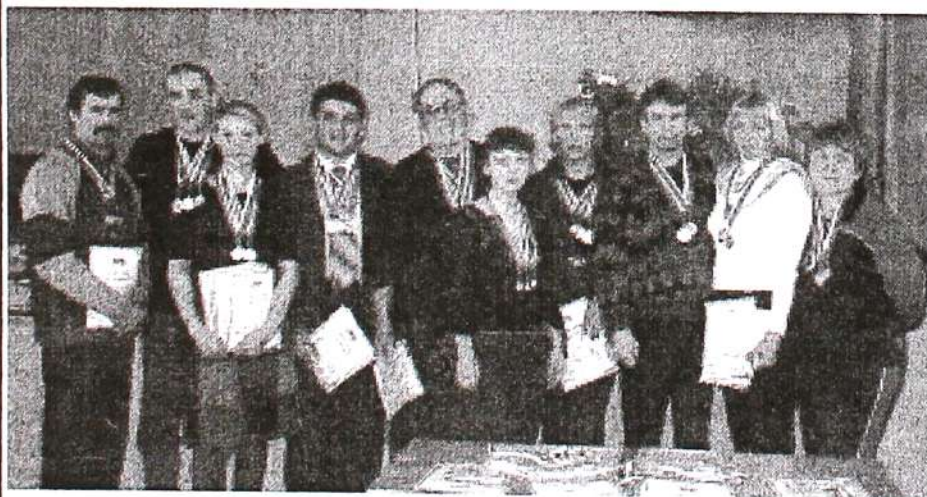
Лучшие из лучших

Несмотря на достаточно большое количество участников (всего приняли участие 427 сотрудников университета), организаторы спартакиады отмечают, что интерес к физической культуре и здоровому образу жизни в ТГПУ невелик. Многие факультеты и подразделения вообще не принимают в ней участие. Возможно, что основная причина неактивности заключается в том, что все состязания проходят в рабочее время и, к тому же, в разных корпусах университета.