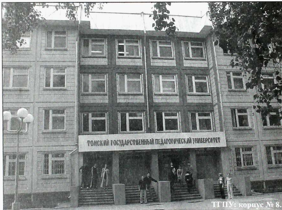
ТГПУ: корпус № 8.