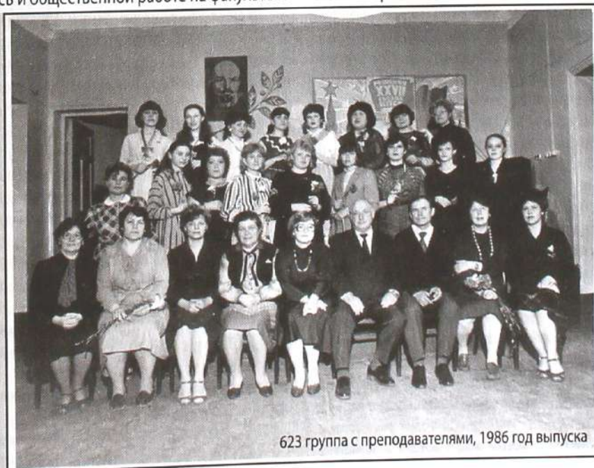
623 группа с преподавателями, 1986 год выпуска