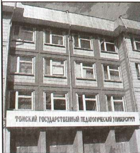
На снимке: 8-й корпус ТГПУ (Каштак).

Факультет осуществляет обучение по нескольким специальностям: педагогика и методика начального обучения, дошкольное образование, логопедия, социальная педагогика. Наши выпускники работают учителями начальных классов, педагогами дошкольного образования, логопедями, социальными педагогами, преподавателями педагогических дисциплин.