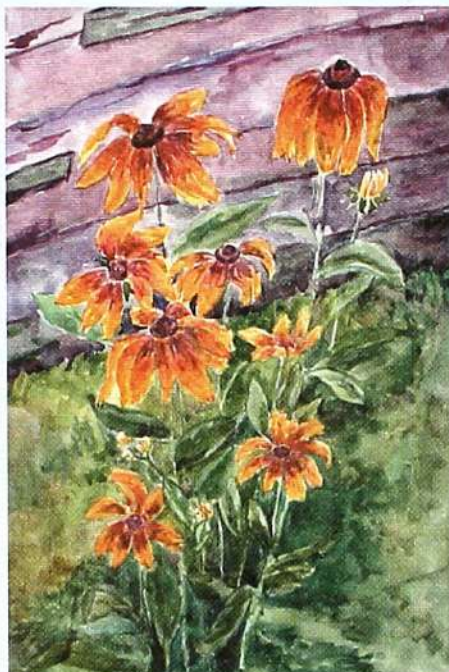
▲ Жёлтые цветы