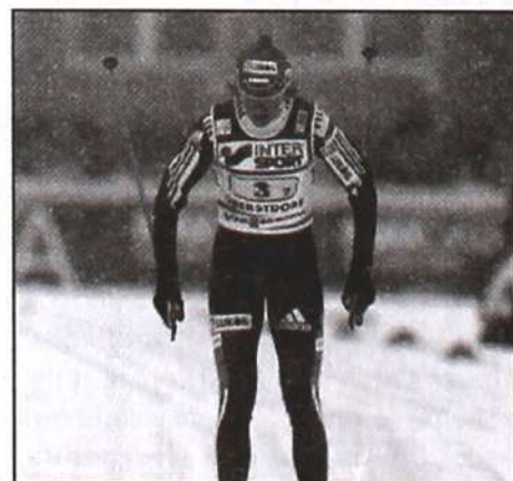
Н. Баранова-Масалкина.

Наталья завоевала высшую награду на олимпийских играх в Турине по лыжному спорту. Каждый из встречающих стремился лично поздравить чемпионку и заполучить автограф у звезды мирового спорта!!!