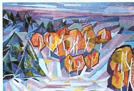
▲ Первый снег

Нет, мама, не бросай меня одну - Девчушка плачет, в детский сад шагая. - Да, доченька, я только лишь взгляну, Что на работе, и опять к тебе, родная.