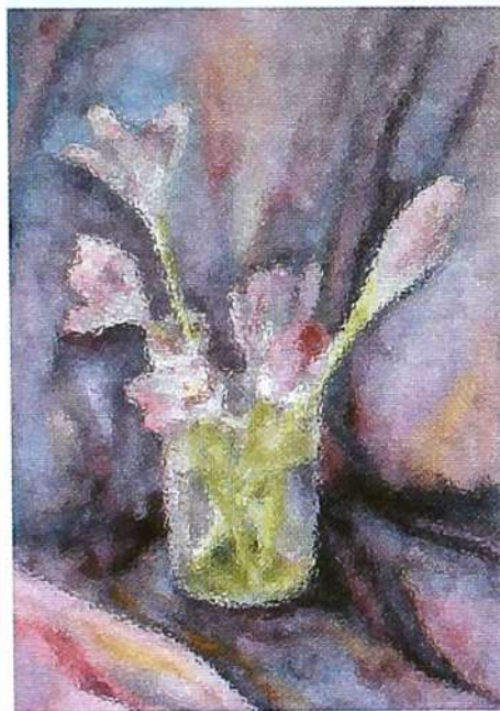
▲ Грустные цветы