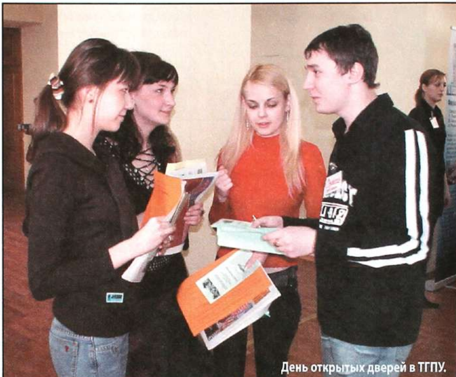
День открытых дверей в ТГПУ.