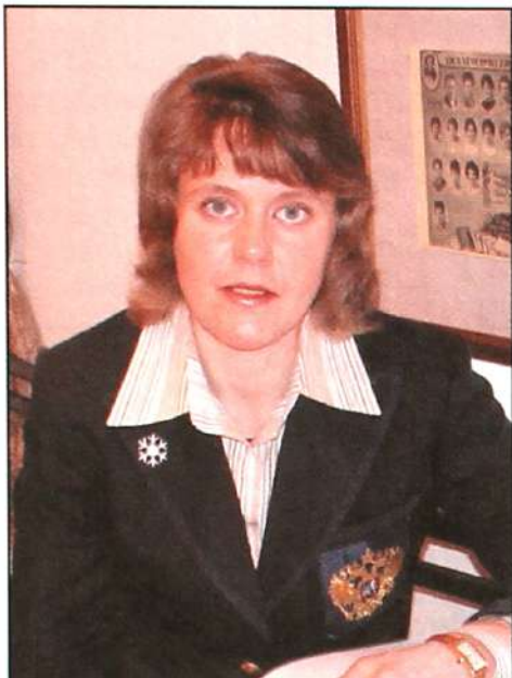
На снимке: олимпийская чемпионка Наталья Баранова-Масалкина, выпускница ФФКиС ТГПУ.