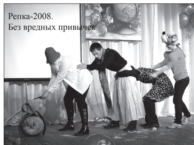
Репка-2008. Без вредных привычек