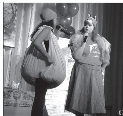
Новый колобок не ушел от деда и бабки. Версия команды ПФ