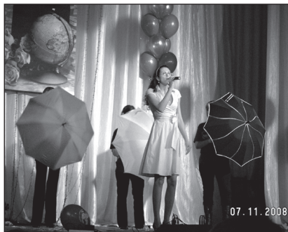
Мисс Совершенство русского языка