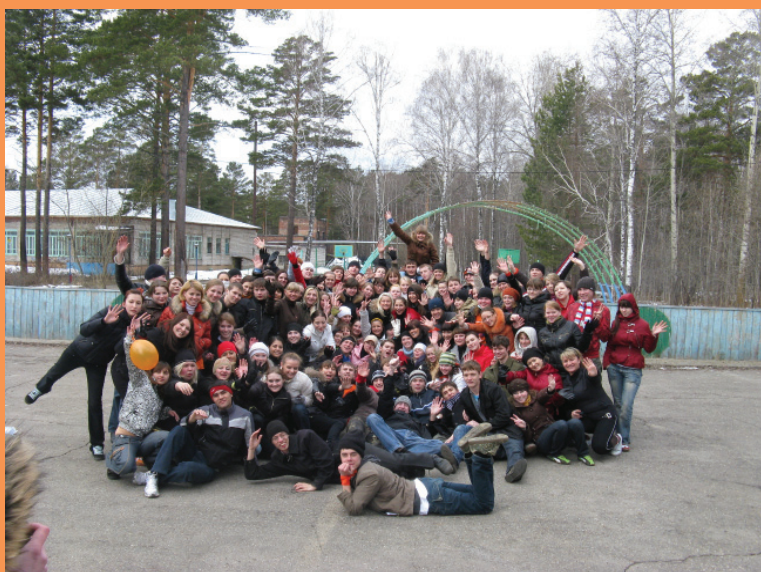
Активисты историко-географического факультета на слете актива. 2008 г.