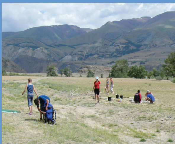
Полевая практика географов