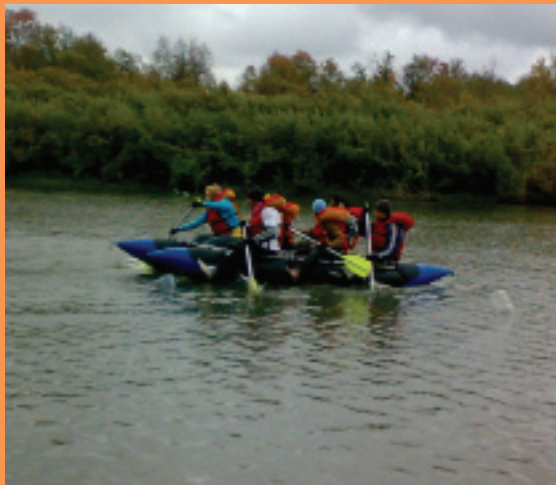
На катамаране. Сплав – 2008 г.