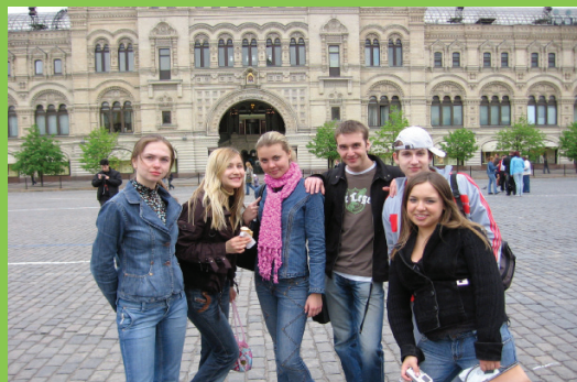
Группа студентов Института культуры в Москве

Кроме практик в музеях г. Томска, в живописном месте на базе практик в п. Киреевск, проходят и замечательные выездные практики в республике Алтай, в г. Новосибирске, в городах Золотого кольца России, в г. Санкт-Петербурге. Полученные на практике впечатления и накопленный опыт остаются со студентами на всю жизнь!