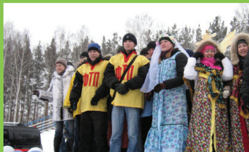
Поучаствовать в спортивных соревнованиях – это не обязанность, это действительно любимое занятие большинства студентов факультета. Даже обучаясь на пятом курсе, они продолжают играть в футбольных, баскетбольных и волейбольных командах.