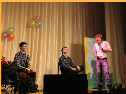
На факультете создана и активно развивается команда КВН NEW STYLE.