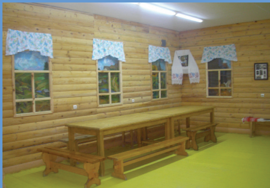
Музей «Русская изба»