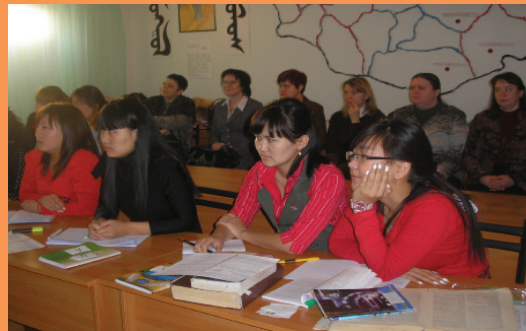
Международная конференция. Монгольские участники.