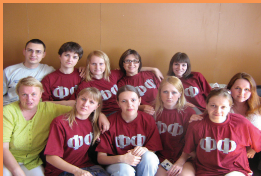
Студенты ФФ – дружная семья