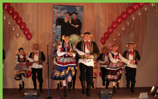
Дни польской культуры в ТГПУ