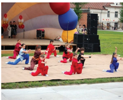
Показательные выступления Федерации у-шу г. Томска