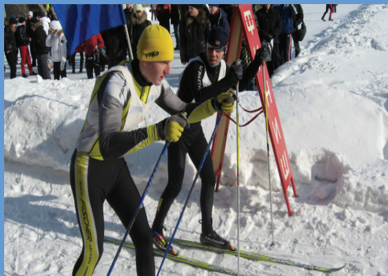
Фестиваль между ФФКС НГПУ и ФФКС ТГПУ