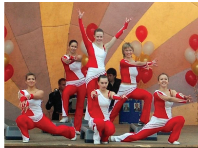
Коллектив спортивной аэробики ФФКС

Было очень много показательных выступлений самих студентов факультета физической культуры и спорта: по ушу, акробатике, спортивной аэробике, спортивной гимнастике, восточным танцам. Факультет поздравляли также творческие коллективы из других университетов, танцевальный коллектив ТПУ и дэнс-команда ЮДИ. В честь факультета со сцены звучали слова поздравления, великолепные песни и превосходные стихи, которые пели и сочиняли