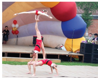
Спортивная акробатика. Сложнейший элемент.