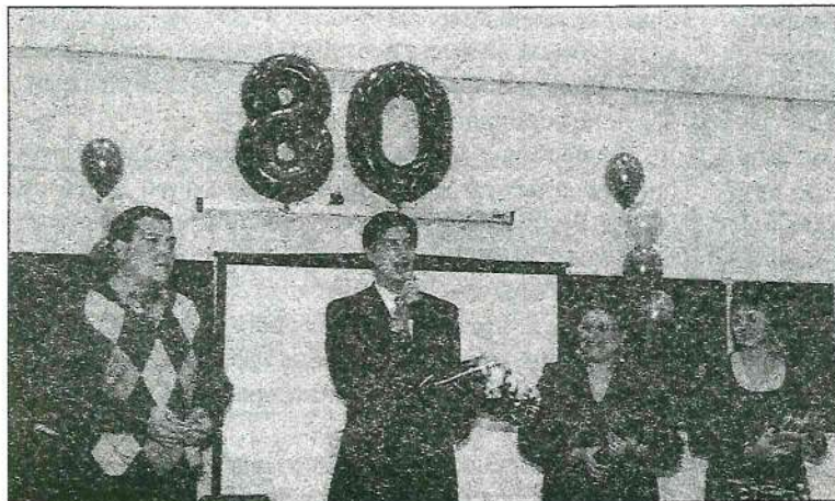
На фото: поздравления директоров школ

Большинство из них стали успешными специалистами в различных профессиональных сферах, но они навсегда в стенах родного факультета будут чувствовать себя учениками, сколько бы лет им не было и каких профессиональных высот в жизни они бы не достигли. Они – птенцы, которые за добрым словом и дельным советом прилетают к родному гнезду. И не только в дни юбилея. Сотрудничество филологического факультета ТГПУ со школами и методическими организациями Томска и области проходит не только в рамках консультаций, школьных олимпиад, методического сопровождения различных городских и областных мероприятий, курсов повы-