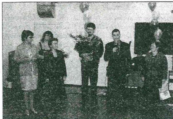
На фото: поздравляют деканы факультетов ТГПУ

Не счесть было гостей, желающих поздравить старейший факультет ТГПУ! Это и представители администрации вуза и города Томска, и деканы факультетов