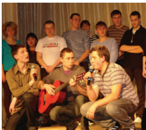
Выступает команда КВН ТГПУ