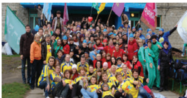
Ежегодный фестиваль спорта и творчества «Стартус»

Именно так считают студенты ТГПУ. И администрация вуза идет им навстречу, финансируя поездки и конкурсы, фестивали и соревнования, создавая клубы, секции и студии. Танцы, туризм, театр, журналистика, вожатская работа, вокал, КВН, литературное творчество, фотография, реклама – вот неполный перечень того, чем студенты педагогического занимаются в стенах университета. Творческую инициативу студентов поддерживают студенческий совет, студенческий клуб, профком студентов и, конечно, деканаты.