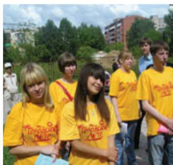
Вожатые проекта ТГПУ для детей, оставшихся летом в городе, «Городское лето»