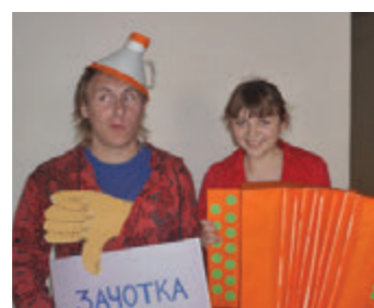
Плакат-победитель конкурса ТГПУ «Недетская реклама»

Студенты – участники проекта «Ночь в музее»