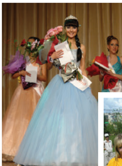
Победительница конкурса красоты «Little-мисс ТГПУ–2010»