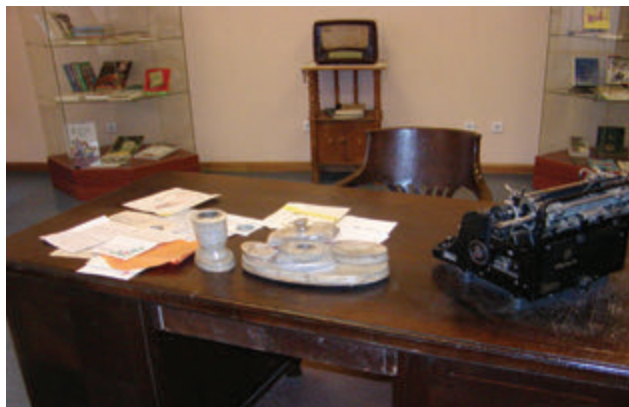
Фрагмент экспозиции музея – письменные стол и принадлежности А.М. Волкова

В детском музее проводятся игровые экскурсии и традиционный (с 2007 г.) городской конкурс знатоков сказок А.М. Волкова, который пользуется большой популярностью в Томске. Регулярно выходит газета для детей и родителей «Изумрудик».