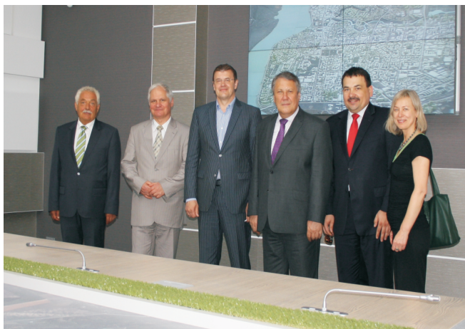
Ректор ТГПУ, мэр г. Томска Н.А. Николайчук и гости из Вроцлавского университета

Говоря о сотрудничестве ТГПУ и Вроцлавского университета, следует отметить, что вот уже на протяжении 13 лет это сотрудничество является весьма плодотворным. Совместно нашими вузами было реализовано много проектов. Каждый год до 10 студентов и аспирантов разных специальностей имеют возможность пройти стажировку сроком от семестра до года. Наши студенты ценят такую возможность и после стажировки долго вспоминают время учебы во Вроцлавском университете. Сотрудники и студенты Томского государственного педагогического университета надеются на долгое и перспективное сотрудничество с Вроцлавским и Хиросимским университетами.