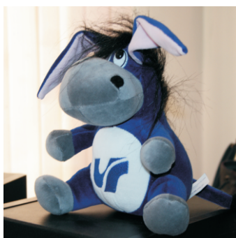
Символ школы польского языка

По совместной инициативе Силезского университета в Катовицах и Томского государственного педагогического университета с третьего по одиннадцатое октября 2012 года на базе польского центра (ИФФ ТГПУ) прошла первая Сибирская школа польского языка и культуры. На протяжении девяти дней более пятидесяти слушателей, среди которых были студенты и сотрудники ТГПУ, с большим интересом изучали польский язык, а также узнавали о традициях, обычаях и достопримечательностях Польши.