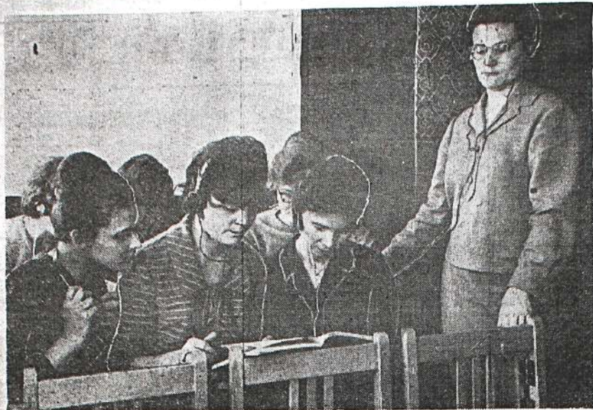
Студенты факультета иностранных языков внимательно прослушивают новый текст в кабинете фонетики.