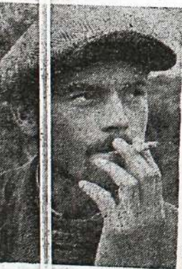
«Одна человеческая сила, помноженная на антузназм, проникла на шестиметровую глубину».