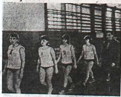
Команда баскетболисток ТГПИ на параде открытия соревнований.

С 4 по 6 апреля в спортивном зале института проводились отборочные игры по баскетболу 7 подзоны Министерства просвещения, в которых приняли участие команды педагогических институтов Кемерово, Кургана, Красноярска, Томска. После торжественного парада и поднятия флага начались игры.