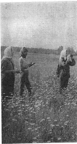
НА СНИМКЕ: студенты на полевой практике.