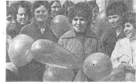
В праздничных колоннах института.