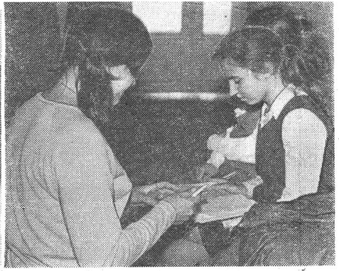
Пролетарии всех стран, соединяйтесь!