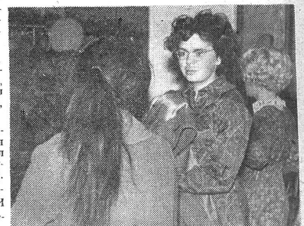
ЗАНЯТИЯ ИДУТ, А ОЧЕРЕДЬ СТОИТ...