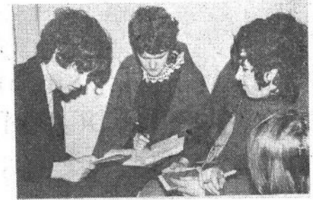
НА СНИМКЕ: студенты II курса ФМФ перед экзаменом по высшей алгебре.