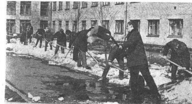
Субботник в разгаре! С большим энтузиазмом и подъемом трудились в этот день и студенты, и преподаватели.