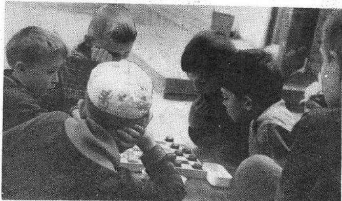
Из фотолетописи I отряда пионерлагеря «Березка»: «Интересная позиция», «На линии огня».

На снимке внизу: на столе руководителя педпрактики.