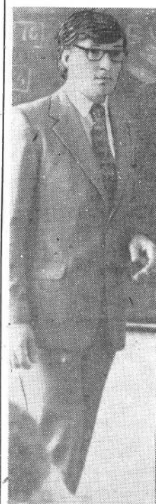
29 октября, как только мы вошли в здание нашего института, то сразу почувствовали какую-то праздничную атмосферу: все комсомольцы пришли на занятия в праздничной форме, комитет комсомола большим, красочным объявлением по-