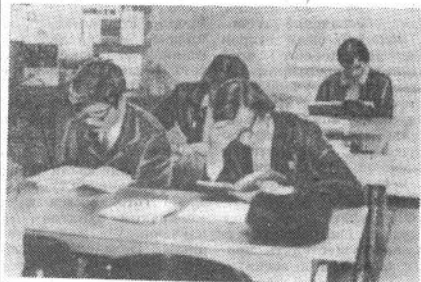
На снимке нашего корреспондента Н. МАЗЕНИНА (162 гр.): в читальный зал № 2 пришла очередная сессия.

Поэтому желаем тебе не волноваться и пройти все формальности без потерь. Если же волнений избежать не удастся, не сваливай ответственность на преподавателя или на случай. Суди себя сам и делай выводы на будущее.