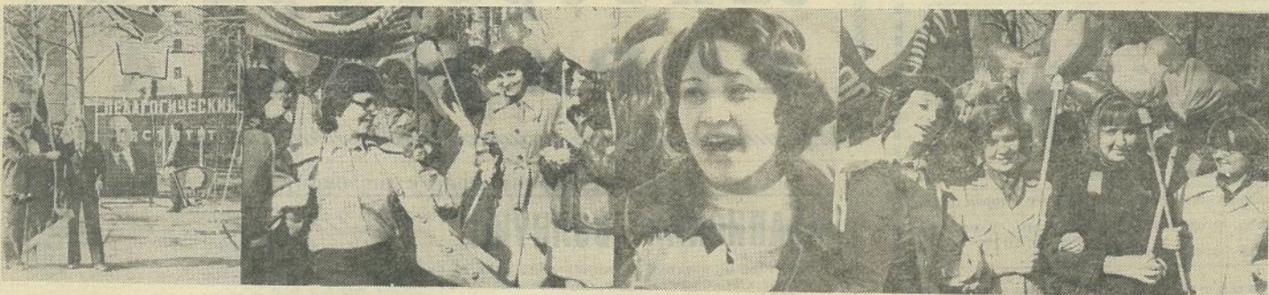
ПРОЛЕТАРИИ ВСЕХ СТРАН, СОЕДИНЯЙТЕСЬ!